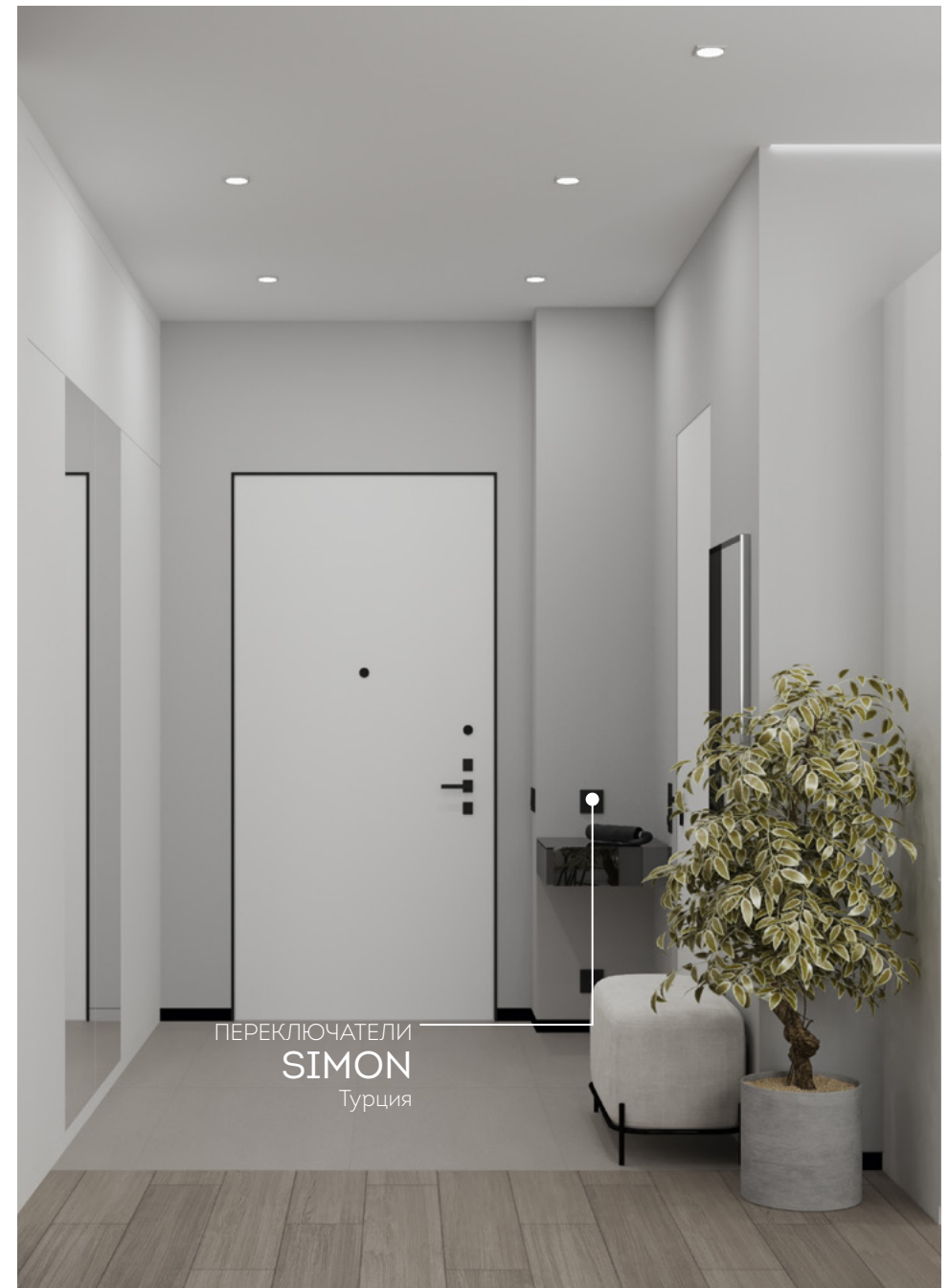
ПЕРЕКЛЮЧАТЕЛИ SIMON Турция