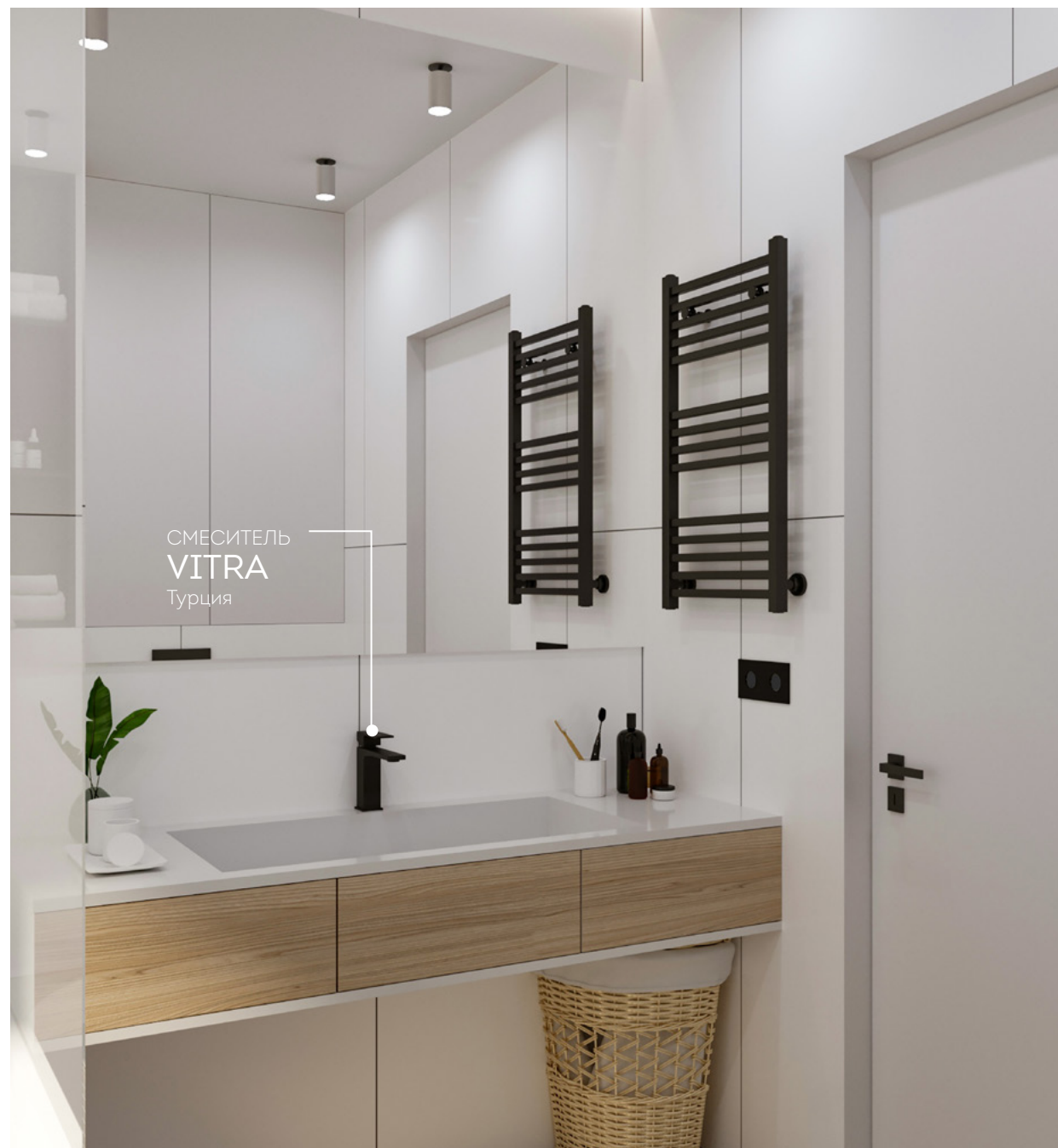
СМЕСИТЕЛЬ VITRA Турция

Визуальные материалы носят информационный характер, в финишную отделку не включены мебель, техника и детали интерьера. Страны производства, модели и артикулы могут быть изменены на аналоги без потери качества.